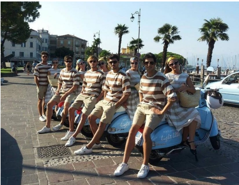
lungolago C. Battisti

- in questi giorni, gli organi d'informazione locali e Nazionali, hanno riportato la notizia che alcuni agenti della Polizia Locale della nostra Città, hanno fatto allontanare dal lungolago C. Battisti, la troupe di Dolce & Gabbana (foto n° 1), in tappa promozionale tra le più belle località d'Italia, poiché “privi di autorizzazione”;